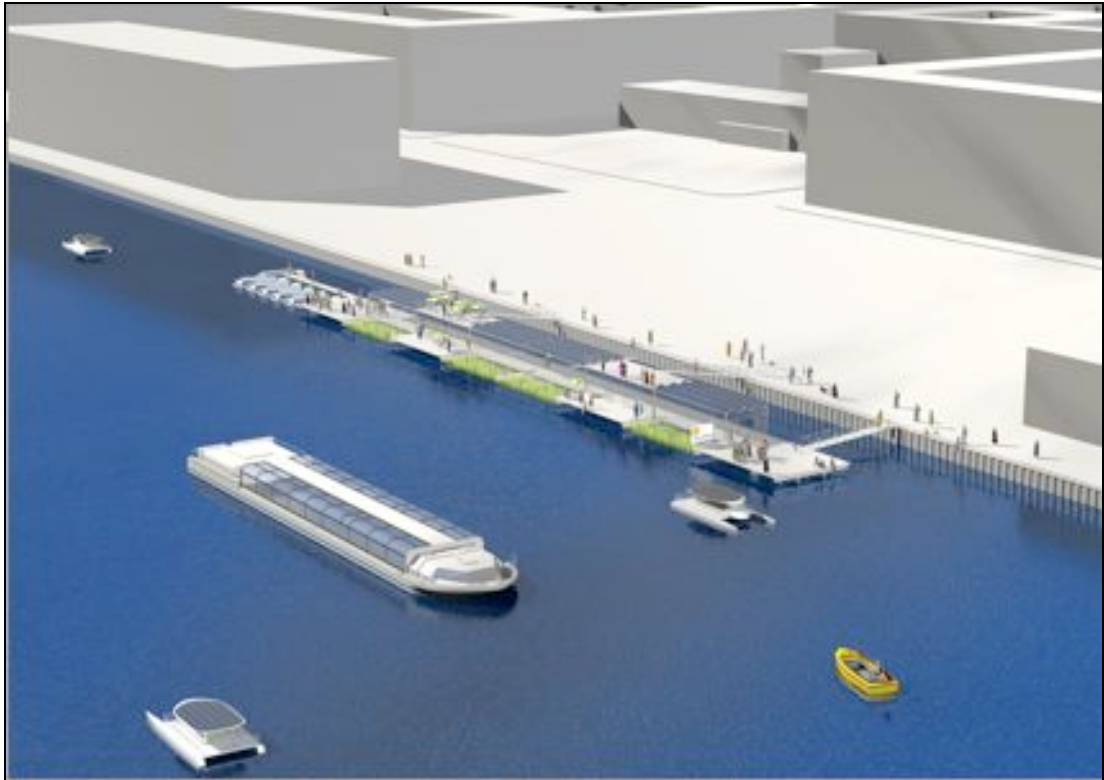
Geplante Pilotanlage im Berliner Osthafen Abb.:luri@sven-flechtsenhar