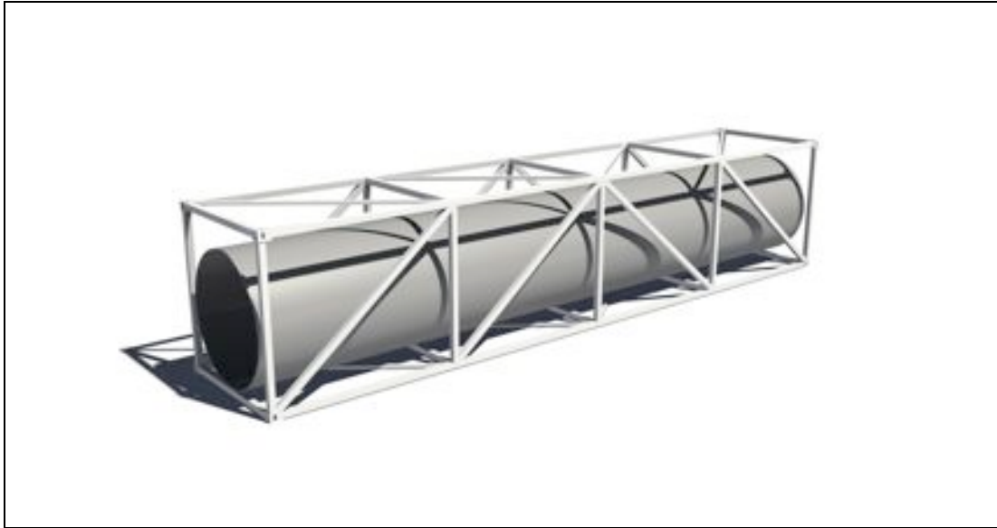
Einzelmodul: Stahltragkonstruktion, GFK-Rohr

Die gesamte Anlage ist am Flussgrund über eine Tiefgründung mit Stahlrohrpfählen verankert, so dass sie nicht aufschwimmt. LURITEC wird mit den für Regenüberlaufbecken üblichen Anlagenteilen ausgestattet. Dazu gehören Pumpen, Abluftreinigung und EMSR-Technik inklusive vollautomatischer Computersteuerung. Die Reinigung nach der Entleerung erfolgt durch Öffnen von Spülklappen.